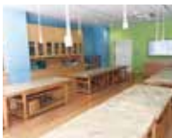
【ものづくり工房】定員/32名 一区あたりの利用料金(税込) 一般/2,560円・営利/7,680円

●研修室A・B(全面利用可) ●スタジオA ●スタジオB ●ものづくり工房 ●キッチン工房 ●企画展示室